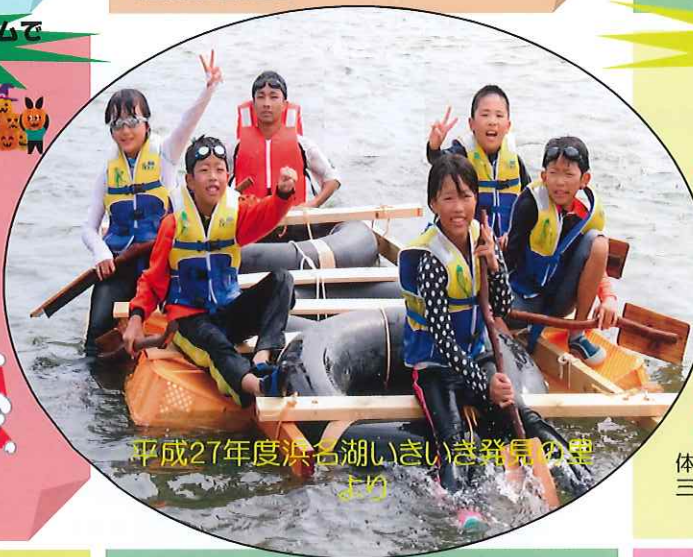
平成27年度浜名湖いきいき発見の里より