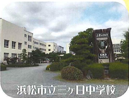
浜松市立三ヶ日中学校