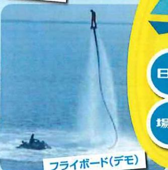
フライボード(デモ)