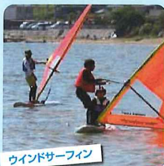
ウインドサーフィン