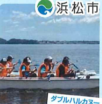
ダブルハルカヌー