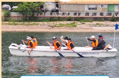
ダブルハルカヌー