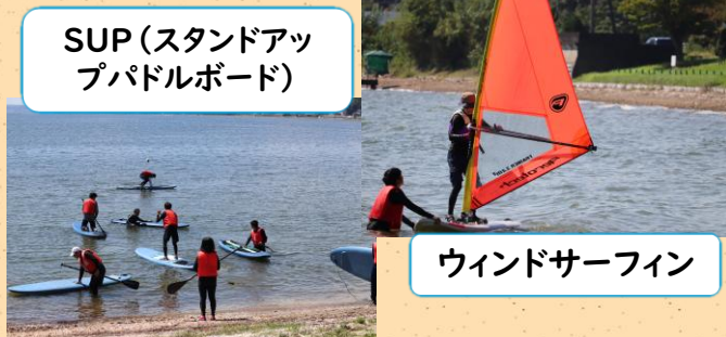
SUP(スタンドアップパドルボード)